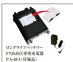
ロングライフバッテリー FNB-85と専用充電器 PA-48A(付属品)