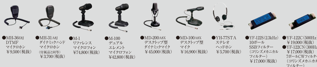
●MH-36E8J DTMF マイクホン ¥9,500(税抜)