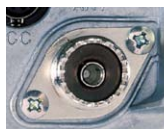
■背面のM型アンテナ端子

パネル面(BNC型)と背面(M型)に、2つのアンテナ端子を装備。バンド毎(HF/50/144/430MHz)に使用するアンテナ端子をメニューモードで自由に設定することができます。